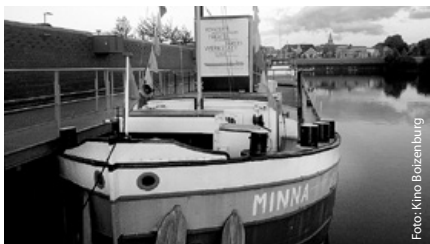
Kulturschiff „Minna“ im Boizenburger Hafen

Infos: Tel. 038836 747138, www.kulturkate.de