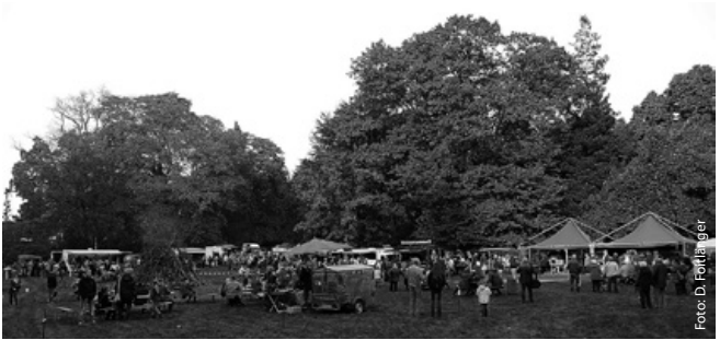
LaubFeuer im Dammereezer Park

Infos: Tel. 038851 3020, Programm: www.elbetal-mv.de