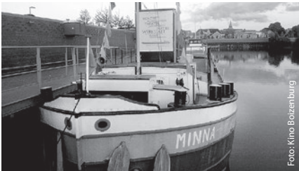
Kulturschiff „Minna“ im Boizenburger Hafen

Infos: Tel. 038836 747138, www.kulturkate.de