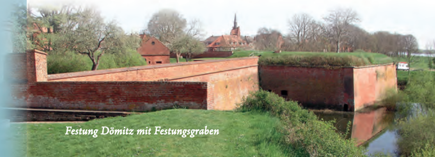
Festung Dömitz mit Festungsgraben