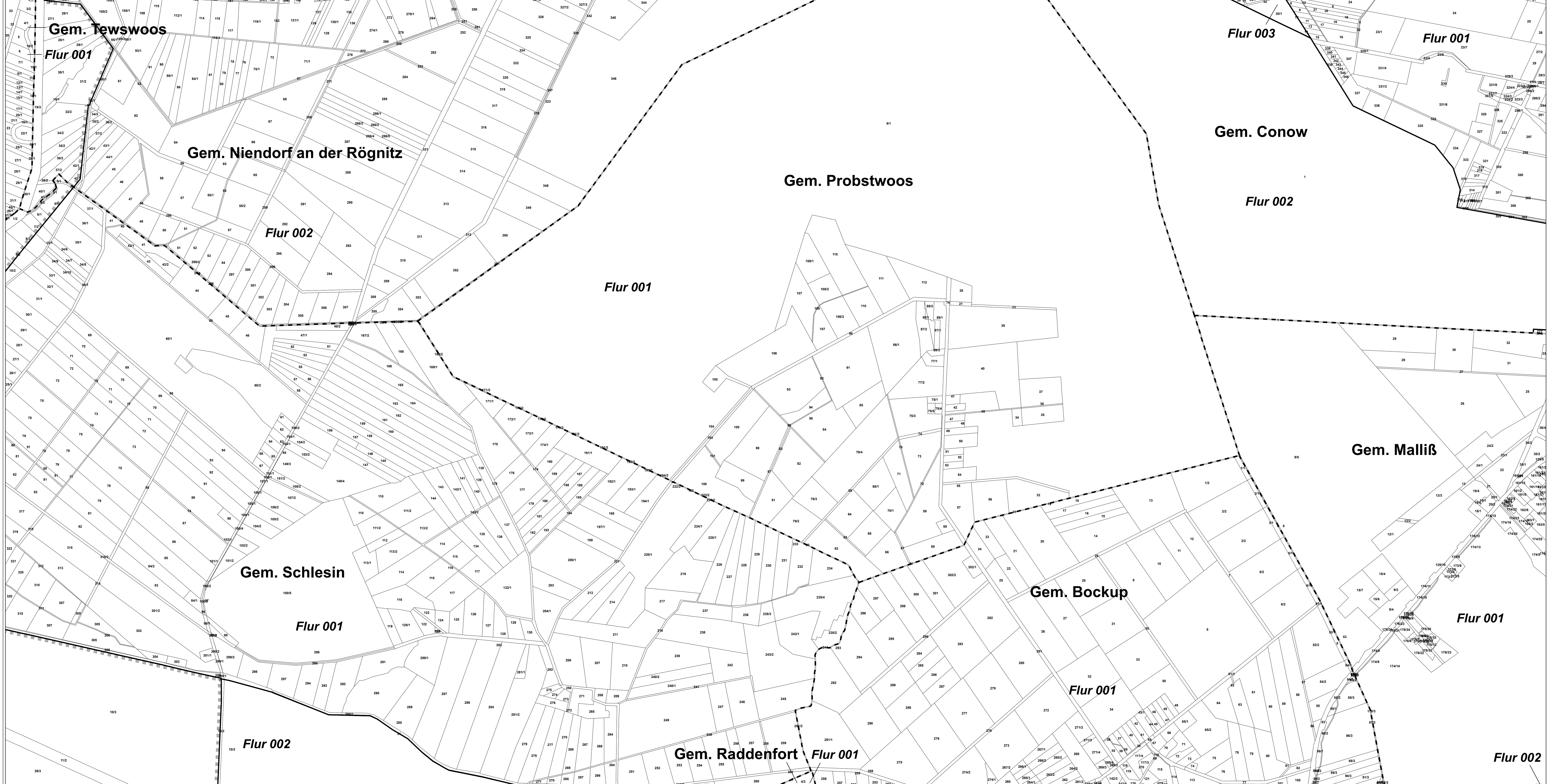
Anlage 2 zum Gesetz über das Biosphärenreservat Flusslandschaft Elbe Mecklenburg- Vorpommern (Biosphärenreservat-Elbe-Gesetz – BREibG M-V), Abgrenzungskarten gemäß § 2 Absatz 3 Abgrenzungskarte Nr. 39